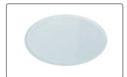
磨砂玻璃滤光片(标配)